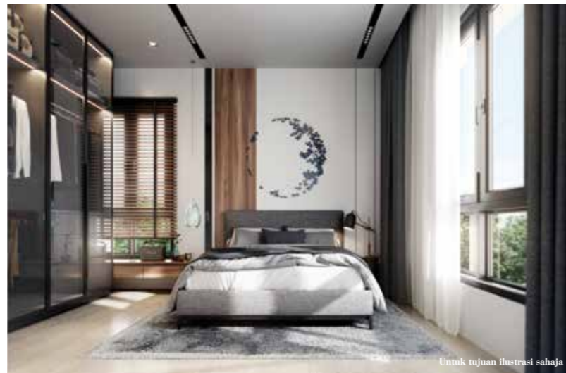
Untuk tujuan ilustrasi sahaja