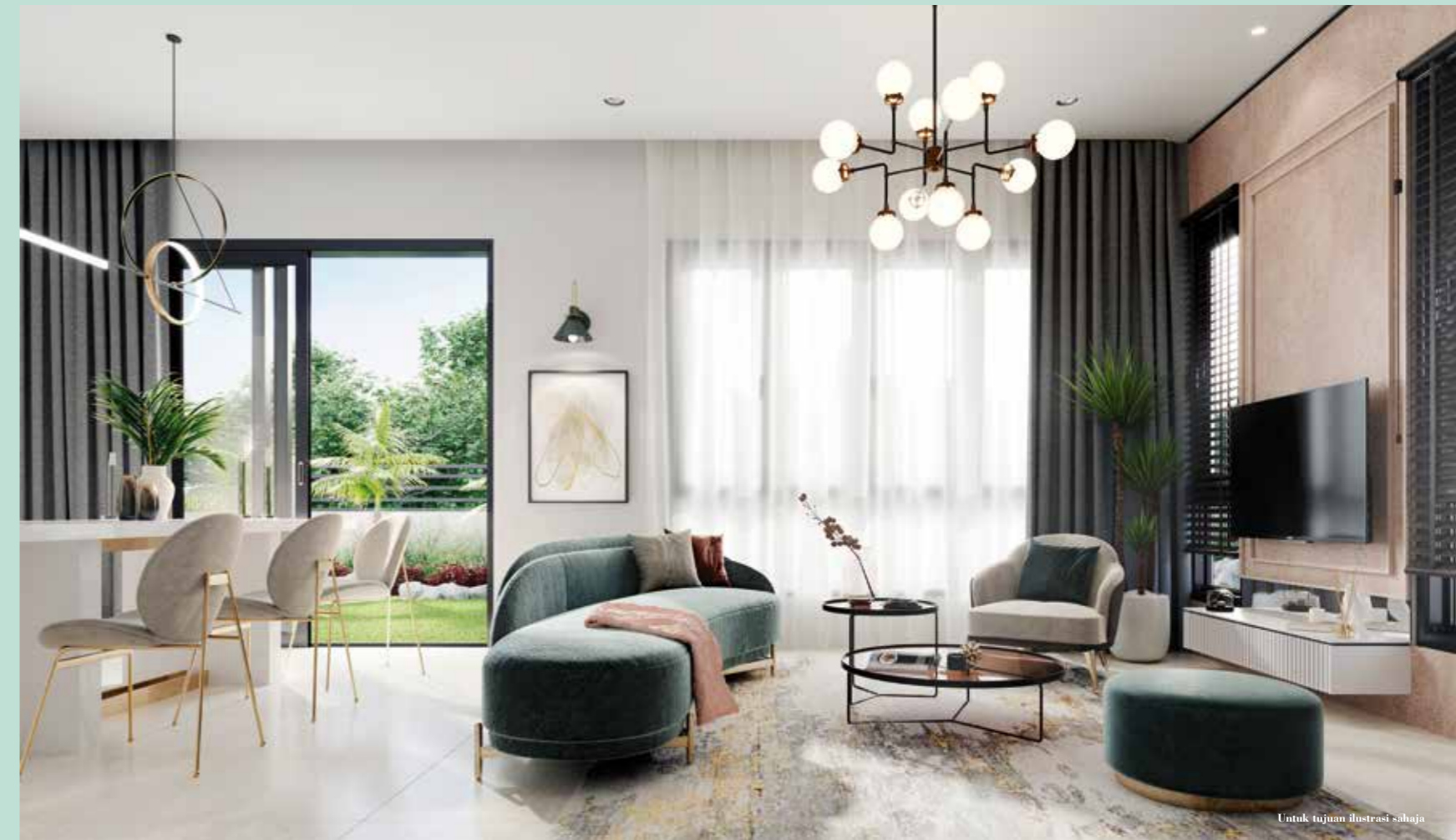
Untuk tujuan ilustrasi sahaja