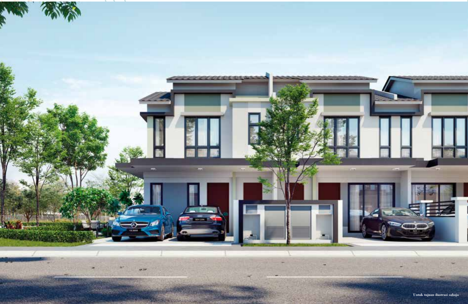
Untuk tujuan ilustrasi sahaja